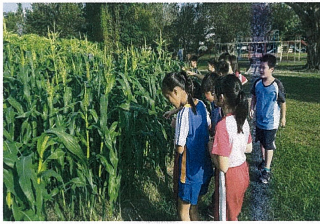
說明：老師帶全班來觀察玉米生長。