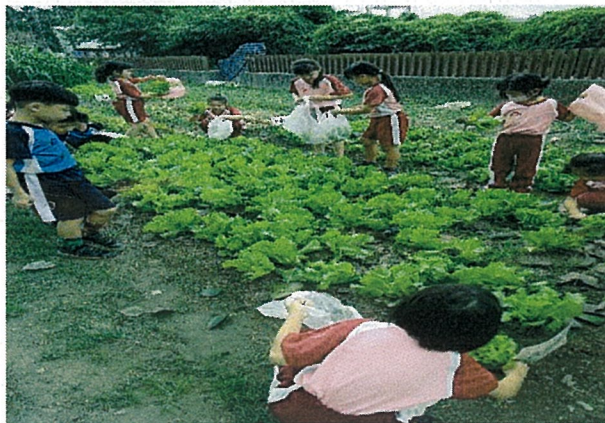
說明：大陸妹大收成喔！