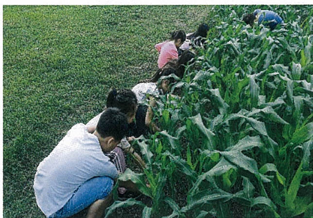
說明：大家一起斬草除根，讓玉米頭好壯壯！