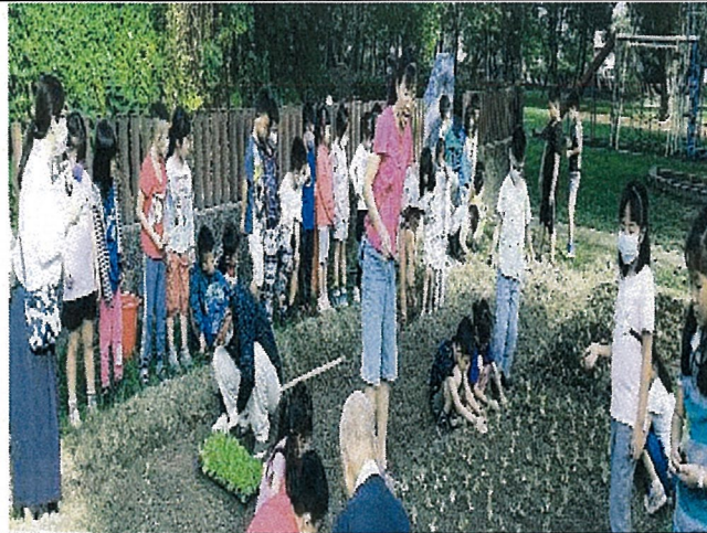
說明：小農夫種菜囉！