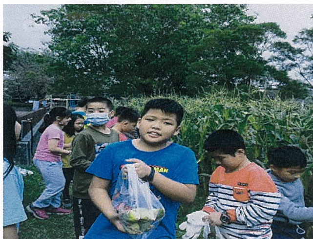
說明：大家一起開心摘玉米