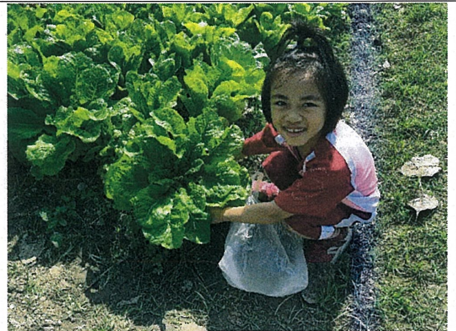
說明：把菜帶回家給家人看