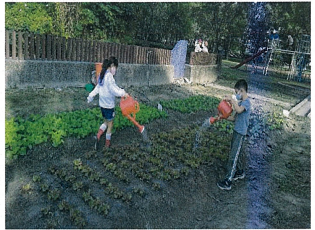
說明：小農夫澆水，快快長大