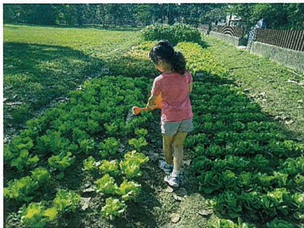
說明：小農夫澆水，快快長大