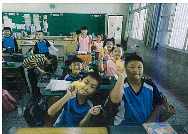
說明：很開心自己種植的玉米健康長大