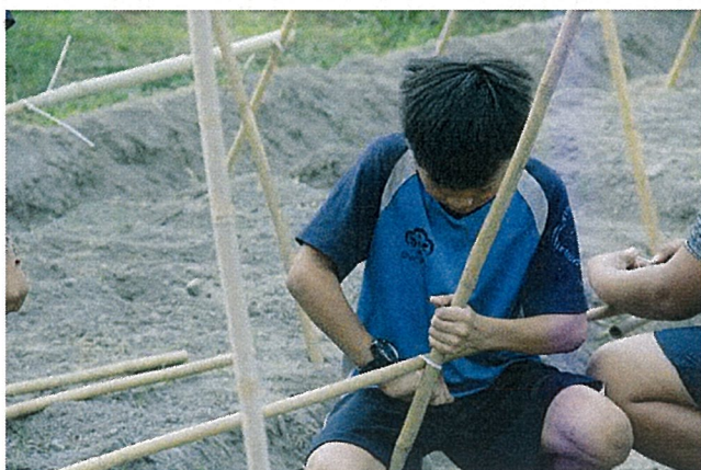
說明: 認真的孩子最可愛