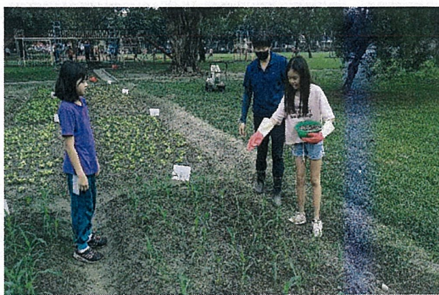
說明：小農夫施肥了