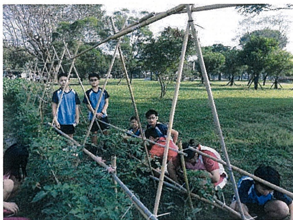
說明：菜圃四周雜草很多，小農夫辛勤地清除雜草。