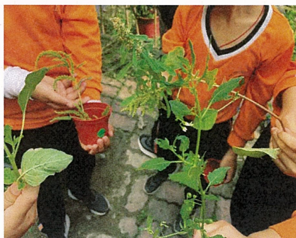
認識校園內的野菜