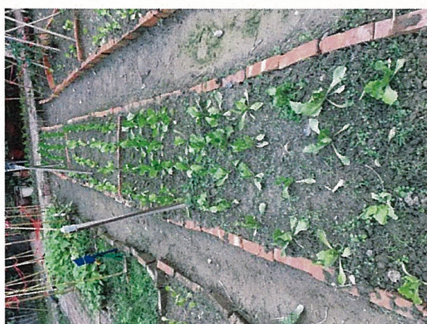
種植當地當季蔬菜