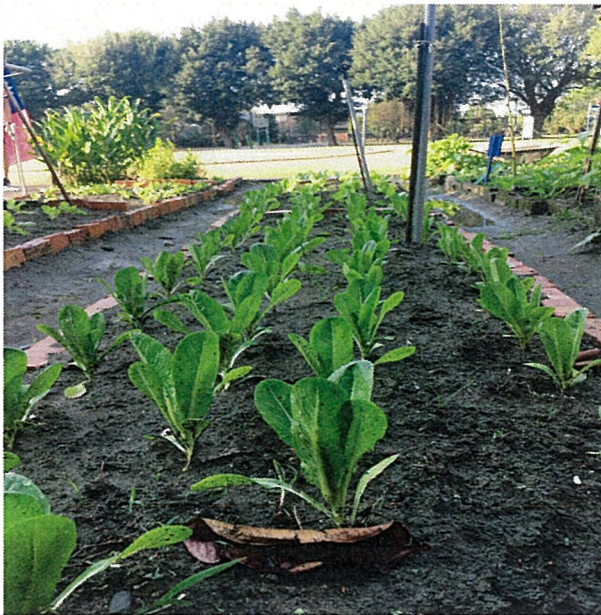
小小蔬果長大成熟準備採收了