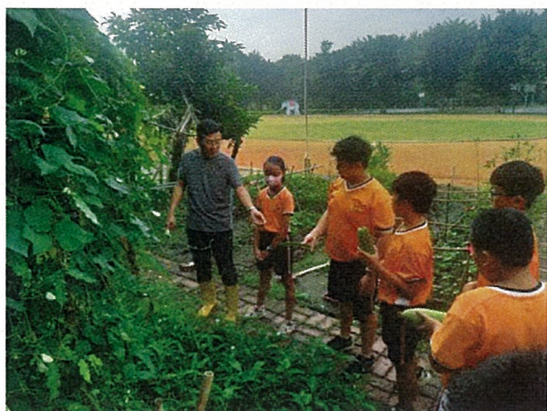
開心農場瓜類收成