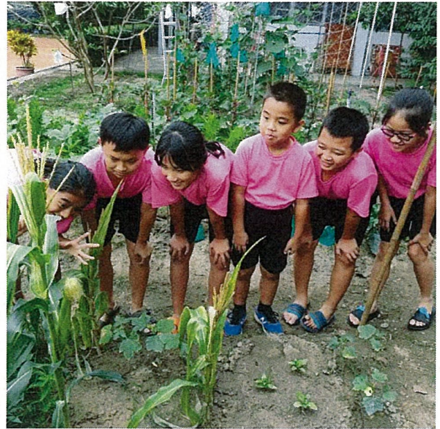
觀察開心農場蔬果生長情形