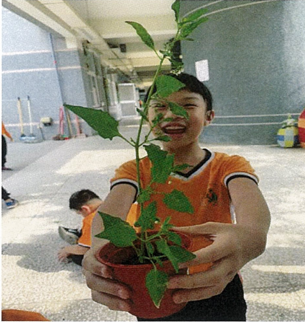
採集開心農場野生植物