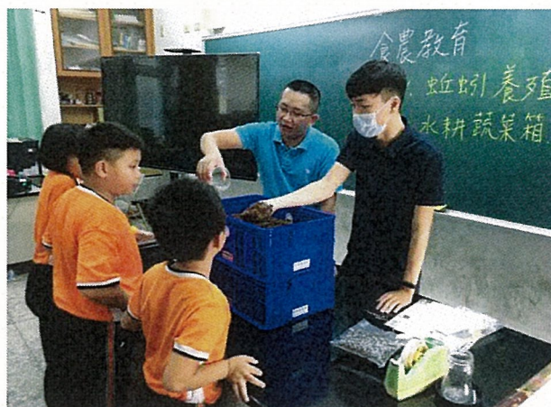
落葉堆肥、蚯蚓養殖及水耕蔬菜