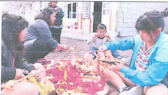
整理採收的紅藜，把紅藜的果實和莖分開。