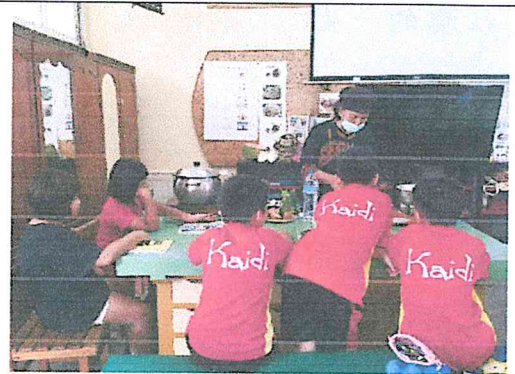
將採收完的農作，自製成佳餚。