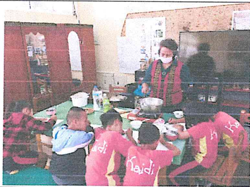
寫食譜，將製作佳餚的步驟寫下。