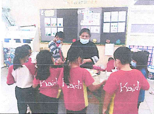
將採收完的農作，自製成佳餚。