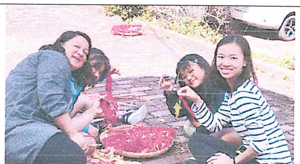
整理採收的紅藜，把紅藜的果實和莖分開。