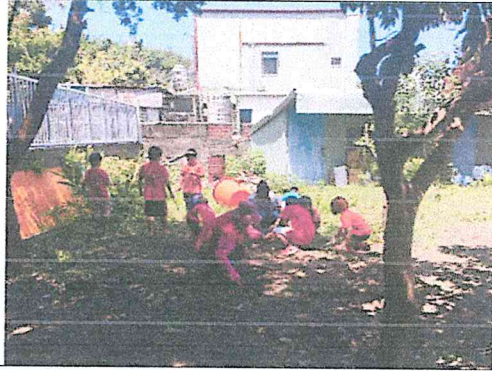
菜園整地，準備種植農作物。