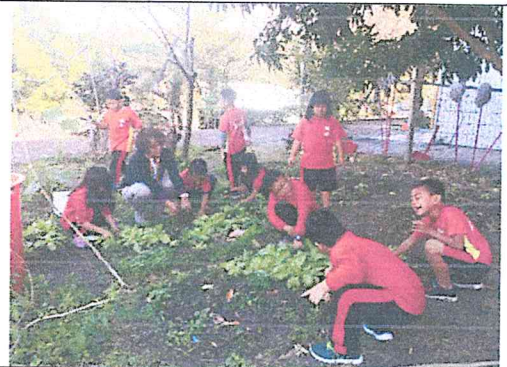
農事耕作，去除農作旁的雜草及澆水。